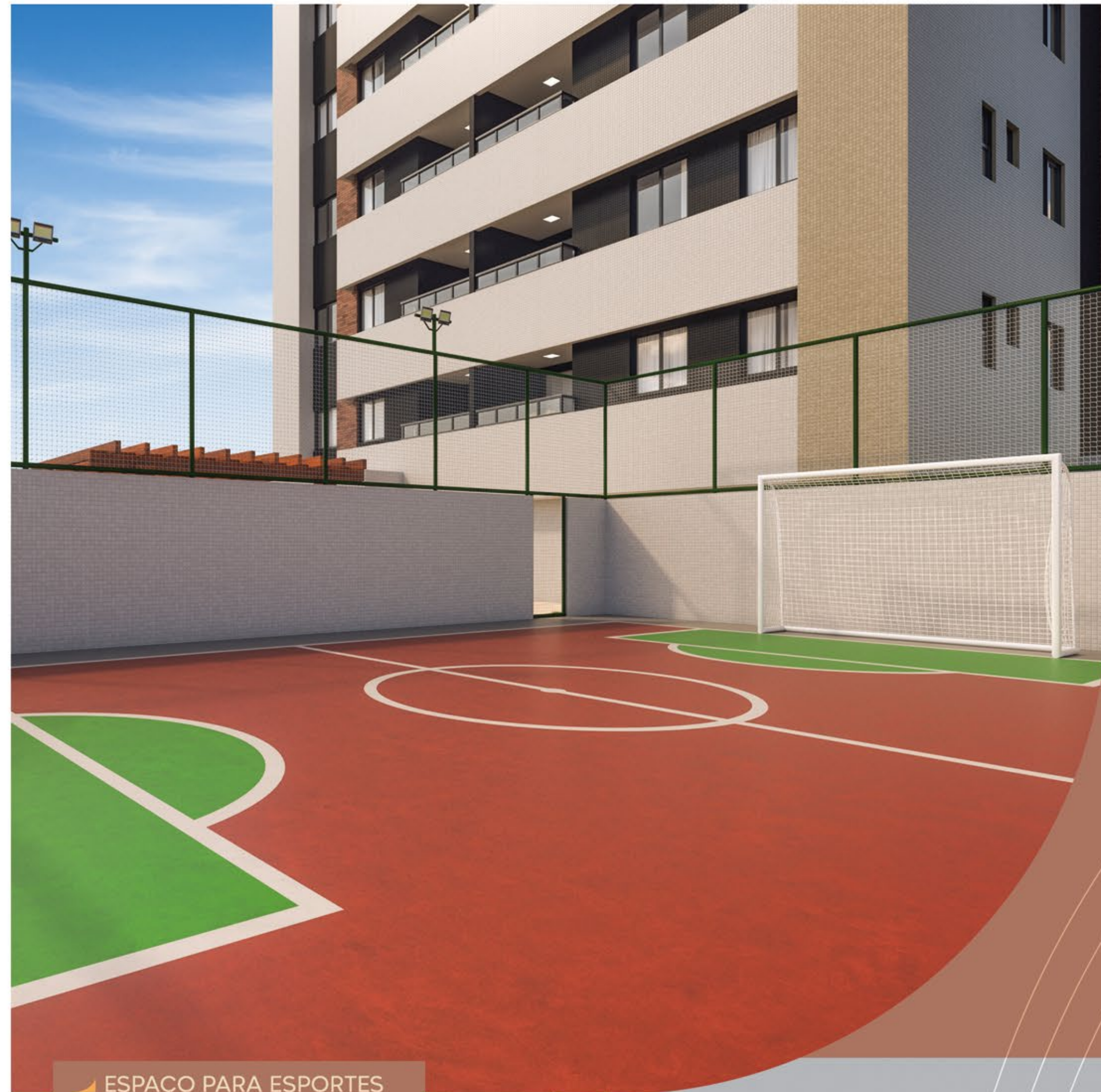
▶ ESPAÇO PARA ESPORTES