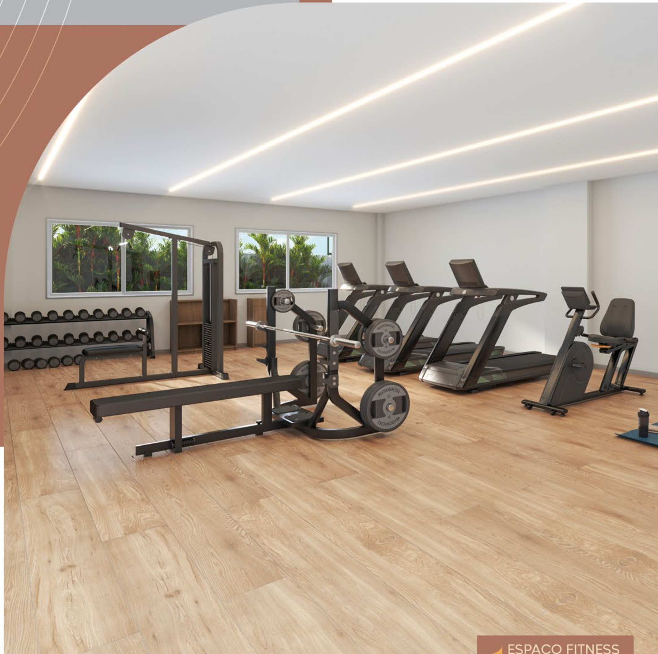
▶ ESPAÇO FITNESS