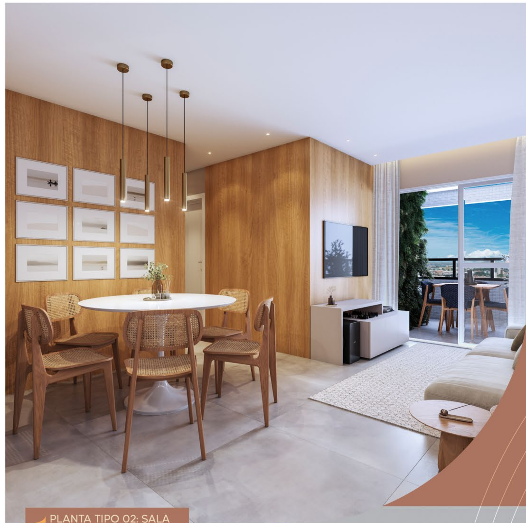
▶ PLANTA TIPO 02: SALA