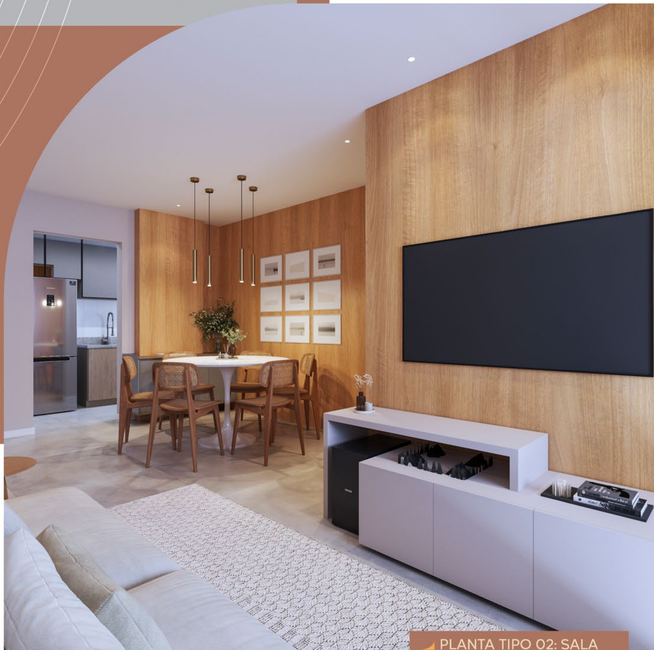
▶ PLANTA TIPO 02: SALA