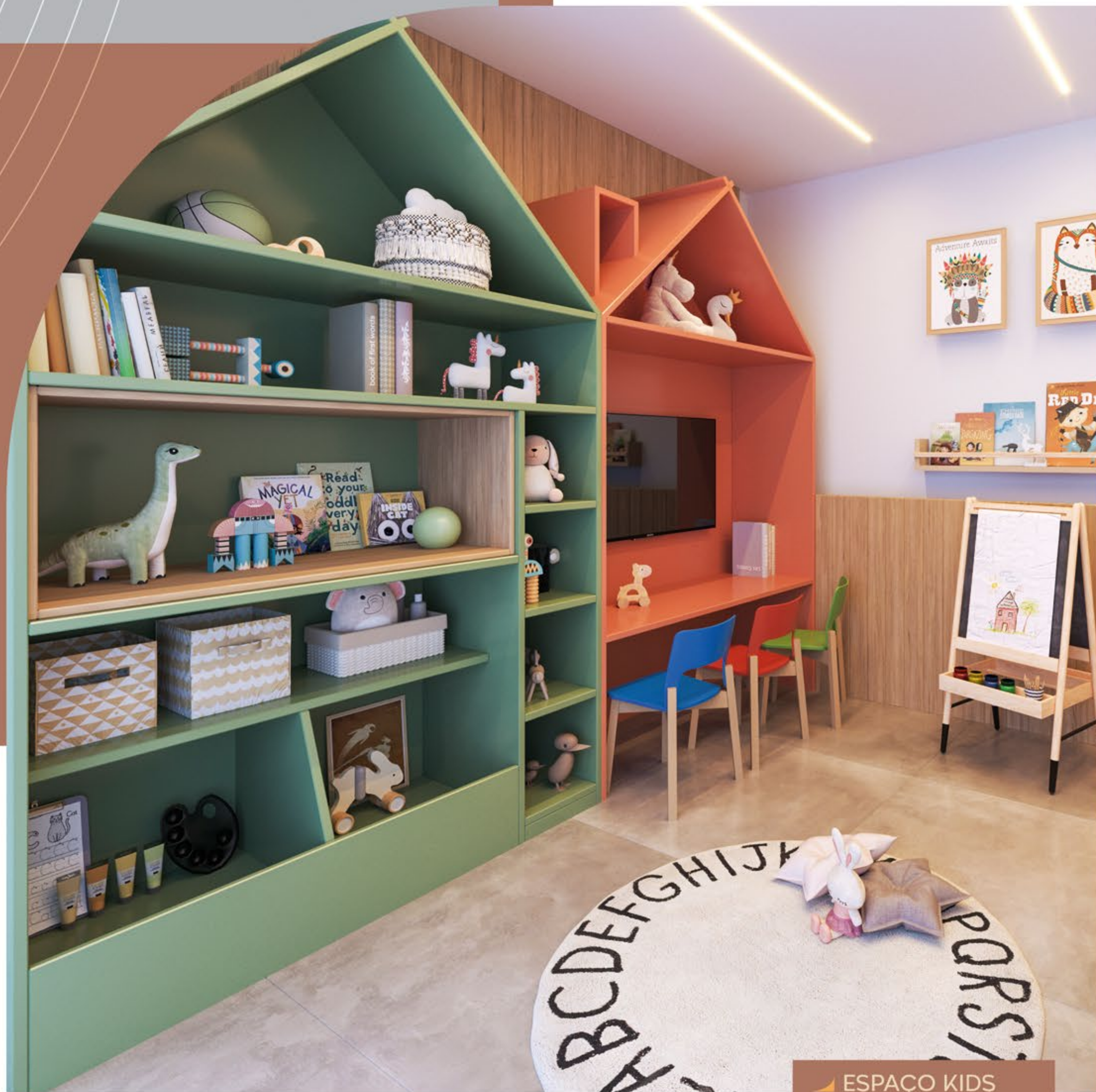
▶ ESPAÇO KIDS