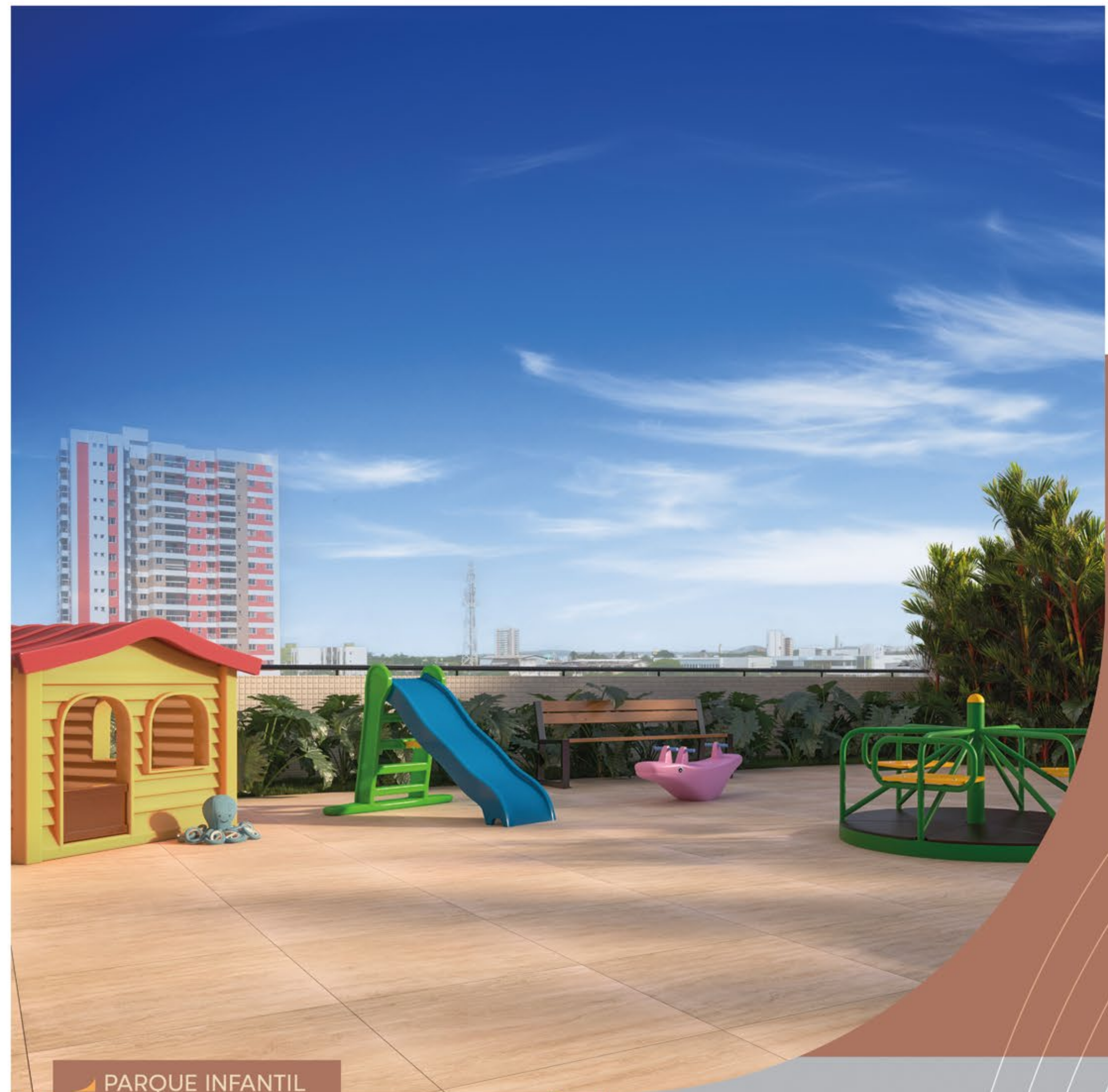
▶ PARQUE INFANTIL