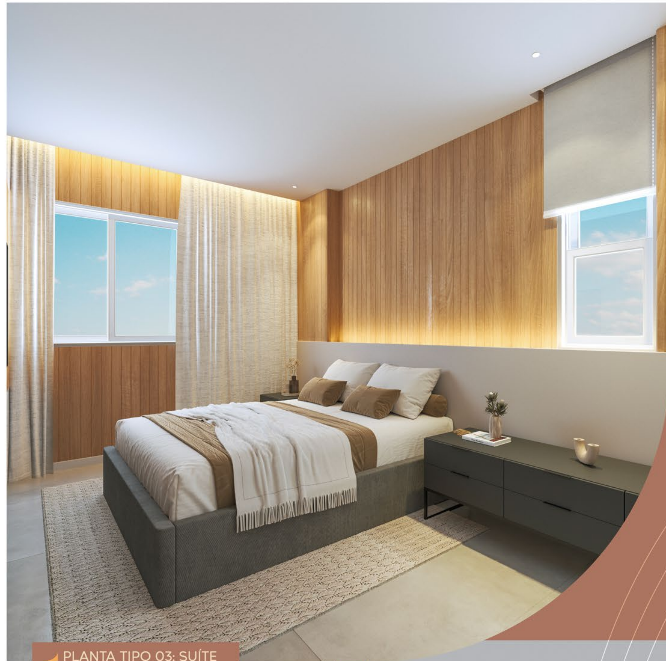
▶ PLANTA TIPO 03: SUÍTE