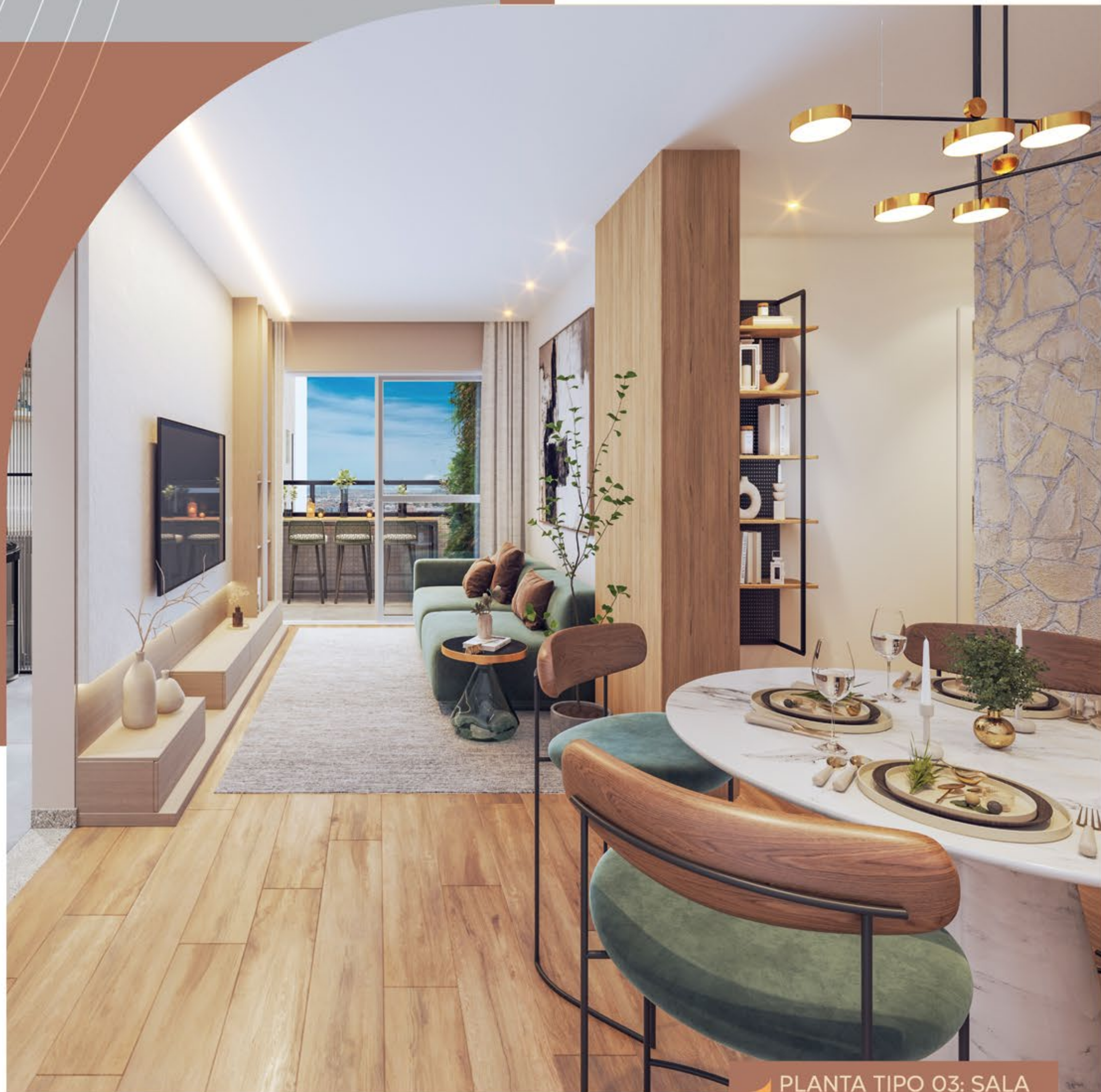
▶ PLANTA TIPO 03: SALA