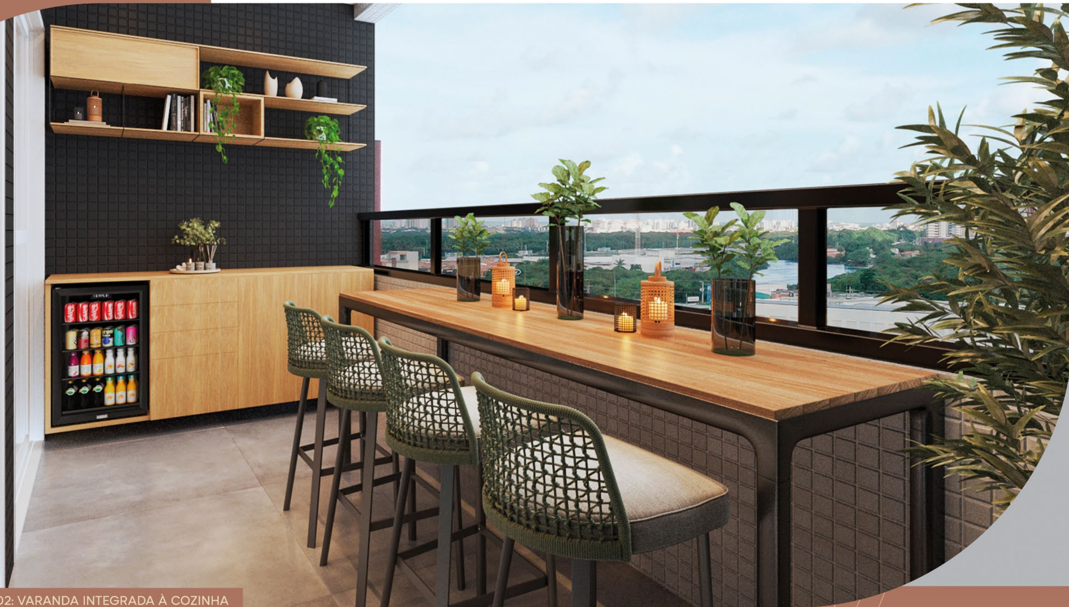
▶ PLANTA TIPO 02: VARANDA INTEGRADA À COZINHA