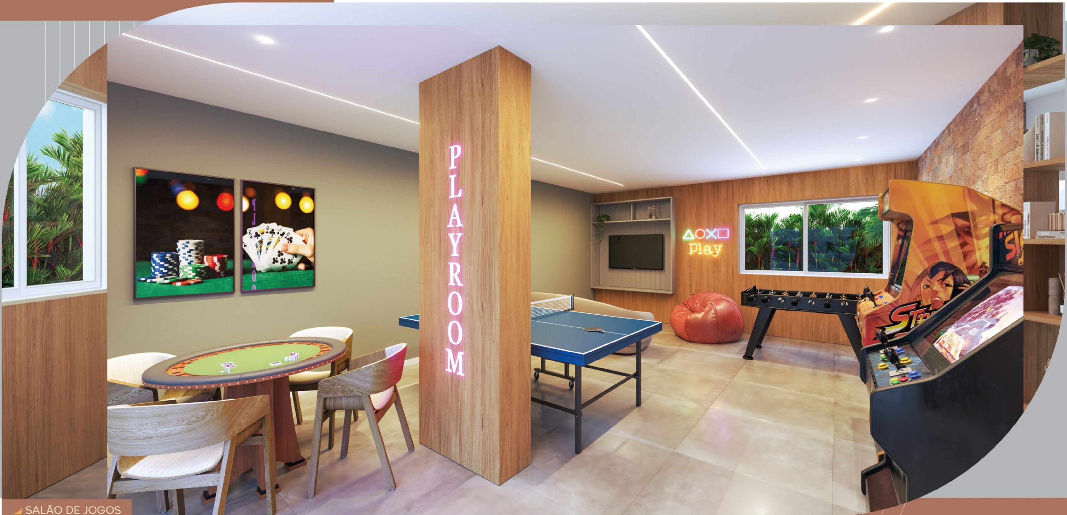
▶ SALÃO DE JOGOS